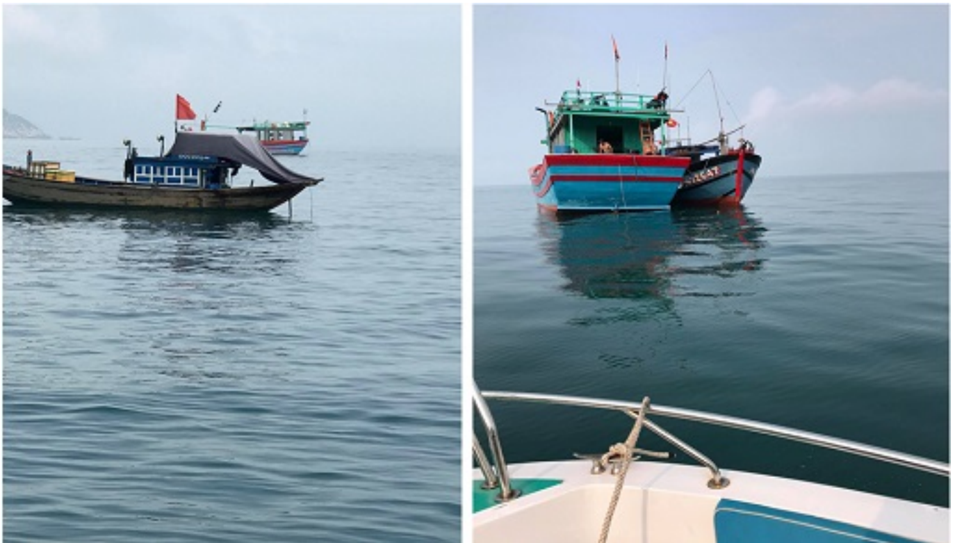
Hình 3 - 4: Các phương tiện khai thác thủy sản ở gần các phương tiện khác đã được truy cập thông và phòng chống dịch Covid-19 tại vùng biển Cù Lao Chàm.

Trong chuyến tuần tra ngày 20/3/2020, lực lượng tuần tra đã tiếp cận 12 phương tiện khai thác ở gần các phương tiện khác đang neo đậu tại vùng biển Cù Lao Chàm. Các phương tiện chủ yếu là thuyền của huyện Núi Thành (04 phương tiện), thuyền mảnh chèo, pha xúc của Duy Xuyên (06 phương tiện). Theo đó, lực lượng chức năng đã kiểm tra thực tế hành chính; hướng dẫn, truy cập thông các quy định về khai thác thủy sản sai quy định - bất hợp pháp tại vùng biển Cù Lao Chàm; đặc biệt quản trị các chài phương tiện và thuyền viên thực hiện nghiêm các quy định và hướng dẫn của UBND xã Tân Hiệp về các biện pháp đảm bảo an toàn cho người dân xã ở trong mùa dịch Covid-19, chính yếu là nghiêm cấm giao dịch, buôn bán, tiếp xúc với người dân địa phương trong mùa dịch.