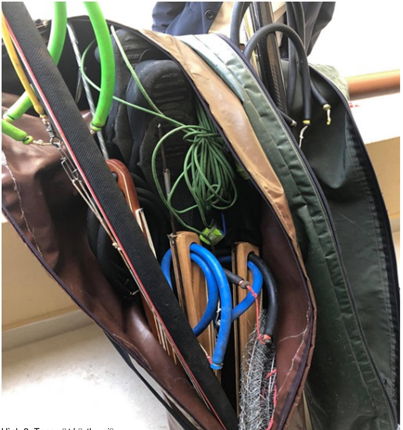
Hình 3. Túi đựng đồ nghề