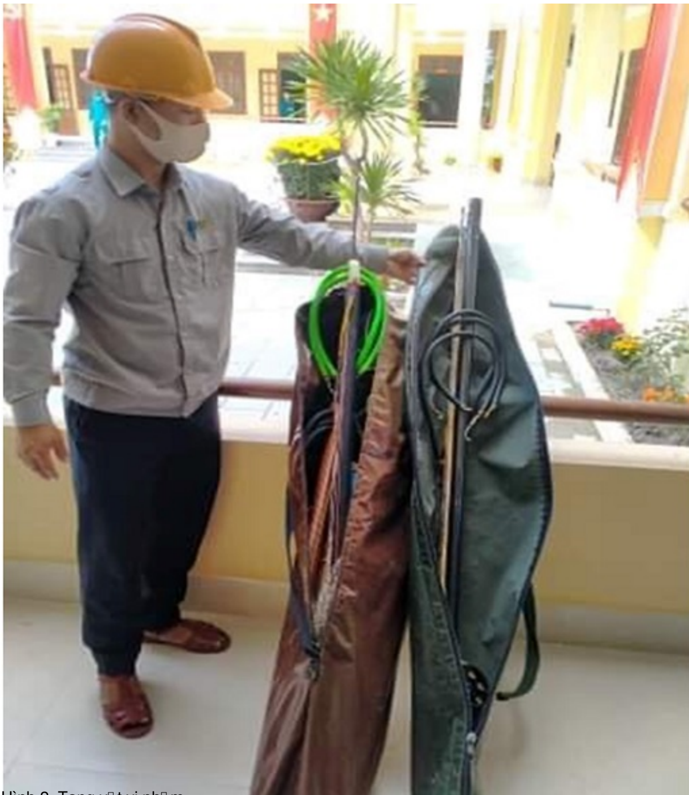
Hình 2. Tang vớt vi phạm