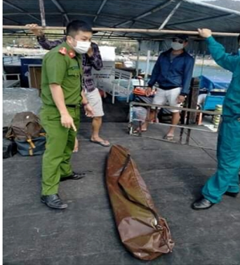
Hình 1: Ban Công an tiếp cận để kiểm tra và tang vật

Một số hình ảnh trong lúc xử lý vi phạm: