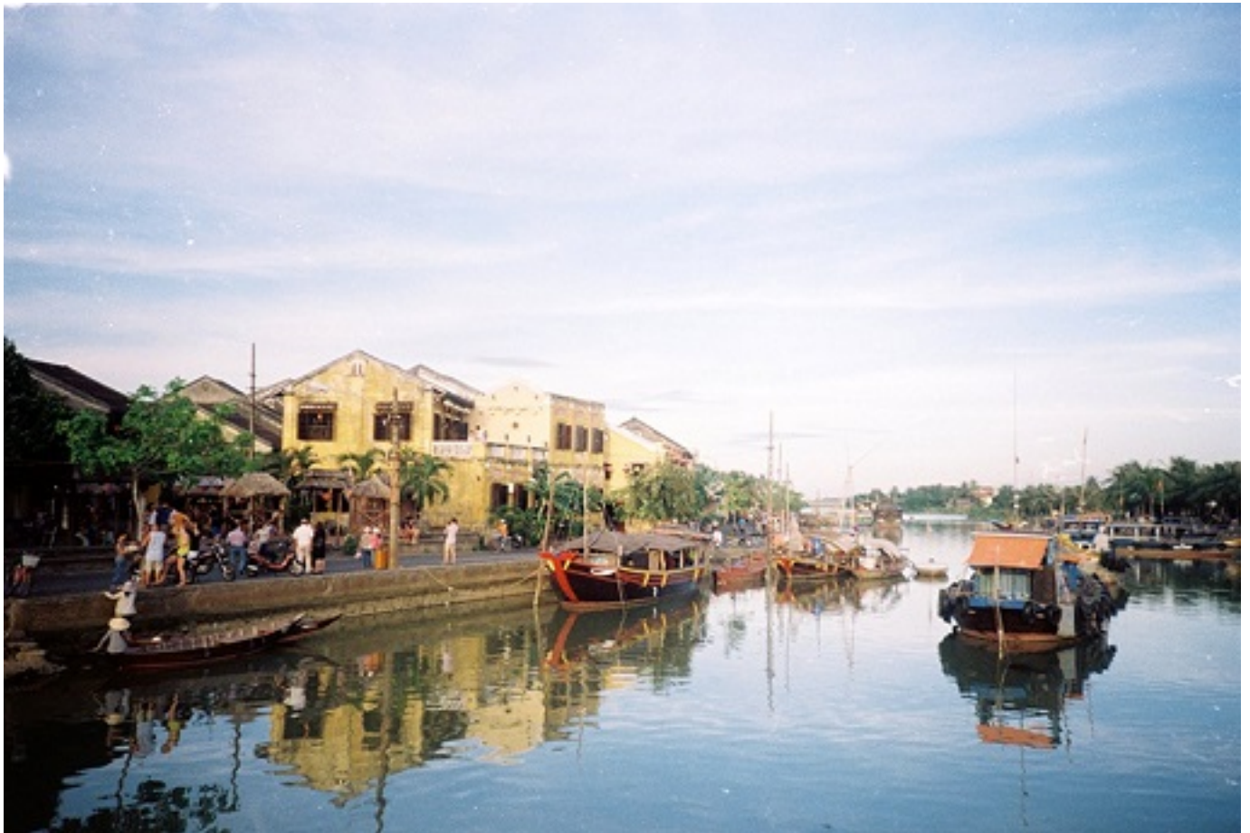
Hình 2: Đô thị cổ Hội An bên dòng sông Thu Bồn nơi kết nối con người và sinh quyển

nhằm, khó triển khai công việc và thực tế hoạt động của BQL KDTSQ trong 4 năm qua rất hạn chế. Vì vậy, chúng tôi đề nghị cấp ủy và BQL KDTSQ Cù Lao Chàm – Hội An như sau: Trên cơ sở các Quyết định UBND thành phố Hội An và việc thành lập BQL KDTSQ Thị trấn Cù Lao Chàm – Hội An, giới thiệu các chức danh bao gồm Trưởng Ban, Phó Ban trưởng và các Phó Ban. Tuy nhiên, các Thành viên, Thành viên chuyên gia và Thành viên kỹ thuật cần phải được miễn nhiệm và tái cấp ủy vào ban chấp hành Thị trấn trưởng BQL KDTSQ và Hội đồng Quản trị KDTSQ.