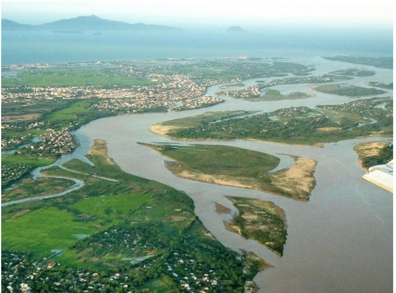
Hình 1: H i u sông Thu B n, Đô th C H i An, Qu n đ o Cù Lao Chàm cũng là n i đ c UNESCO công nh n danh hi u Khu D tr Sinh quy n Cù Lao Chàm – H i An

Ban Qu n lý Khu D tr Sinh quy n Th gi i Cù Lao Chàm – H i An (BQL KDT SQ) đ c thành p theo Quy t đ nh s 2336/QĐ-UBND ngày 17/7/2009 và Quy t đ nh s 3159/QĐ-UBND ngày 15/10/2009 c a UBND thành ph H i An. C c u c a BQL bao g m Tr ng Ban, Phó Ban tr c, các Phó Ban và các thành viên, giúp vi c cho BQL có T chuyên gia và T k thu t.