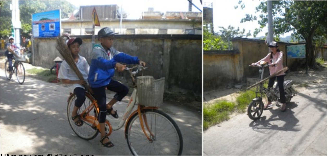
Hôm nay em đi đến trường