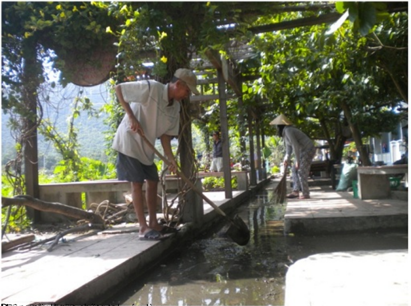
Mũi nhọn của chiến lược xanh xóm làng