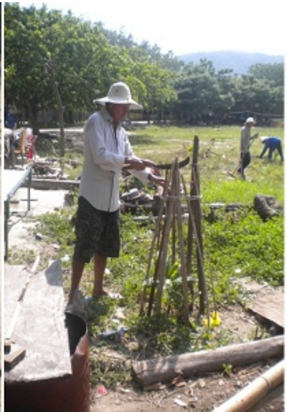
Trồng thêm cây xanh cho đời thêm sạch