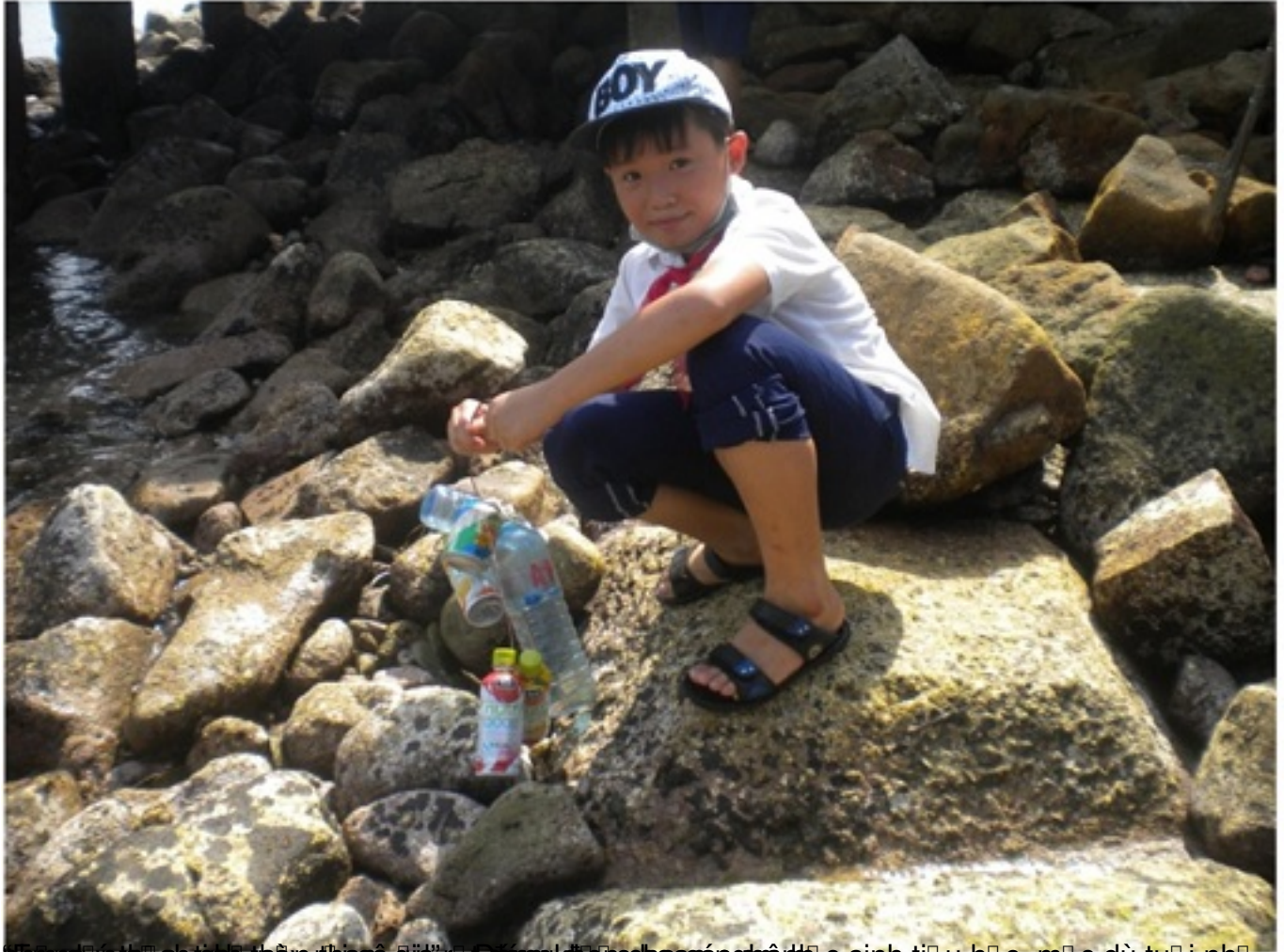
Hôm nay em đi đến trường