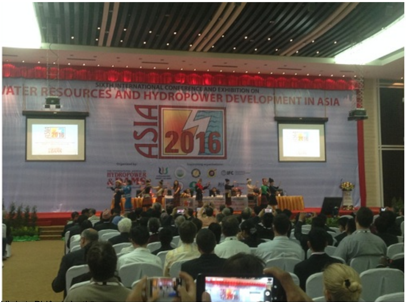
Hình 1: Phiên toàn thể