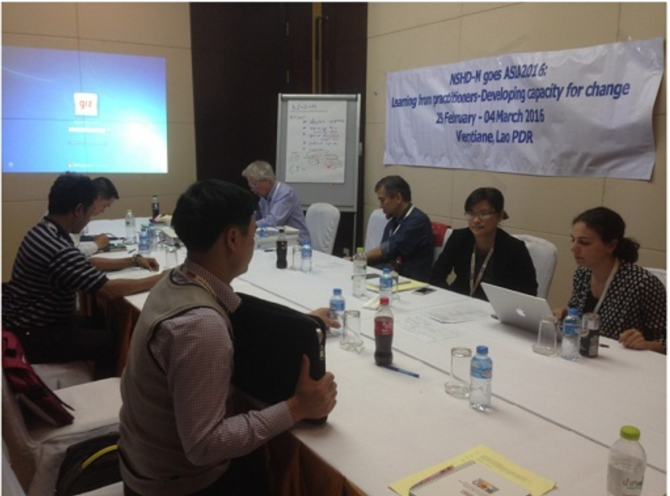
Ảnh chụp tại Hội nghị (Giz) nhân chuyến công tác của NSHD-M tại Lào và Campuchia