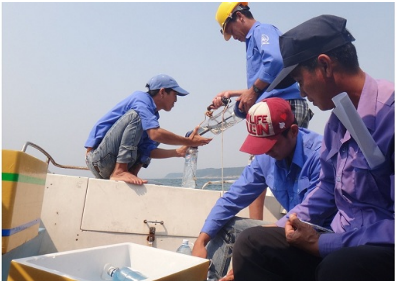
Hình 1: Cán bộ KBTB lấy mẫu nước

Liên quan đến số cơ sở cá chết tại các tỉnh Bắc Trung Bộ vừa qua, ngày 28/4/2016, UBND Thành phố Hội An đã chỉ đạo Ban quản lý Khu bảo tồn biển Cù Lao Chàm tiến hành lấy mẫu nước tại 07 điểm: Bãi Làng, Bãi Bức, Hòn Dài, Hòn Nhàn, Mũi Đông phỉ sau Hòn Lao, Hòn Thùng Hòn Tai, Bãi Bìm để phân tích chất lượng nước biển. Kết quả phân tích tại Đài Khí tượng Thủy văn Trung trung bộ: 17 chỉ tiêu gồm pH, TSS (Tổng chất rắn lơ lửng), DO (Oxy hòa tan), NH 4 N (Amoni), As (Asen), CN - (Xianua), Hg (Thủy ngân), Cd (Cadimi), Pb (Chì), Cu (Đồng), Zn (Kẽm), Cr (Crom), Cr 6+ (Crom 6), Fe (Sắt), Phenol, Mn (Mangan), PO 4 (phosphat) cho thấy chất lượng nước biển tại Cù Lao Chàm nằm dưới giới hạn cho phép, đảm bảo yêu cầu phục vụ mục đích nuôi trồng thủy sản, bảo tồn thủy sinh, bãi tắm và thể thao dưới nước (theo Quy chuẩn kỹ thuật quốc gia về nước biển – Bộ Tài nguyên Môi trường, 2015).